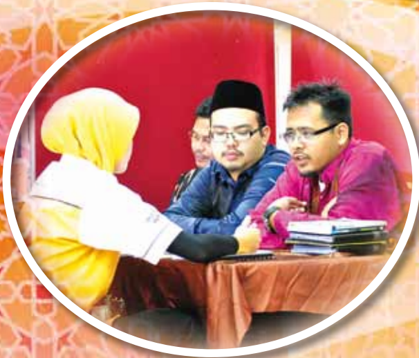
MAIPK MEMBUKA KAUNTER PELANGGAN DI POLITEKNIK UNGKU OMAR, IPOH PADA 08 MAC 2012