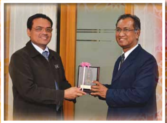
PENOLONG SETIAUSAHA BAHAGIAN KEWANGAN MEWAKILI MAIPK MENERIMA CENDERAMATA DARIPADA PIHAK UNIVERSITI MALAYSIA PERLIS SELEPAS MESYUARAT ANTARA KEDUA-DUA PIHAK PADA 15 FEBRUARI 2012