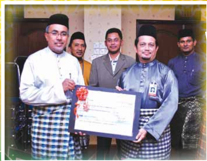
PENYERAHAN ZAKAT PERNIAGAAN BERJUMLAH RM160,977.00 OLEH TELEKOM MALAYSIA BERHAD CAWANGAN PERAK KEPADA KETUA PEGAWAI EKSEKUTIF MAIPK PADA 13 APRIL 2012