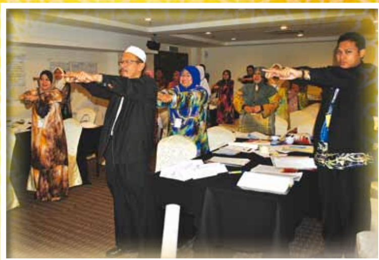
PARA PESERTA SEDANG MENGIKUTI MODUL OLEH PENCERAMAH DALAM BENGKEL APLIKASI PSIKOLOGI KHIDMAT PELANGGAN YANG DIADAKAN PADA 21 SEHINGGA 23 FEBRUARI 2012