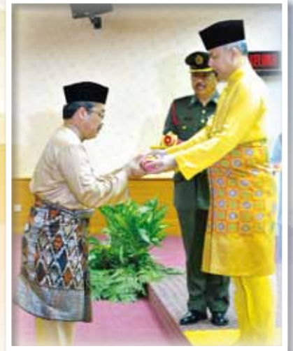
GAMBAR BAWAH : PEGAWAI KEWANGAN NEGERI PERAK MENERIMA WATAKAH PELANTIKAN DARIPADA DYTM. RAJA MUDA PERAK