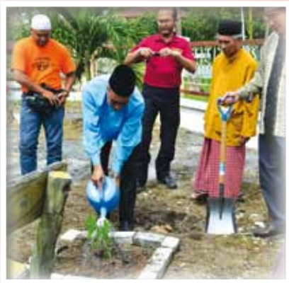
KETUA PEGAWAI EKSEKUTIF MAIPK MELAKUKAN SIRAMAN POKOK BUNGA SEBAGAI SIMBOLIK PERASMIAN PENUTUP PROGRAM DI MASJID AL-FALAHIAH, KG. CHANGKAT TIN, TG. TUALANG

B ATU GAJAH – Pada 19 Februari 2012, MAIPK Batu Gajah dengan kerjasama masjid-masjid Daerah Batu Gajah dan juga kumpulan E-Tiraff Bikers telah menganjurkan Program Ride Imarah Masjid (RIM 2012). Program yang bertemakan "Teman, Mike, Kome Sayang Masjid!!!" itu melibatkan para pekhidmat MAIPK Batu Gajah, para penunggang motosikal berkuasa tinggi daripada kumpulan E-Tiraff Bikers serta masyarakat kampung sekitar kawasan yang terlibat.