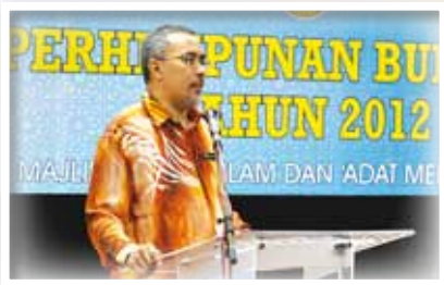
KETUA PEGAWAI EKSEKUTIF MAIPK SEDANG MENYAMPAIKAN UCAPAN PADA PERHIMPUNAN BULANAN MAIPK BIL. 02/2012