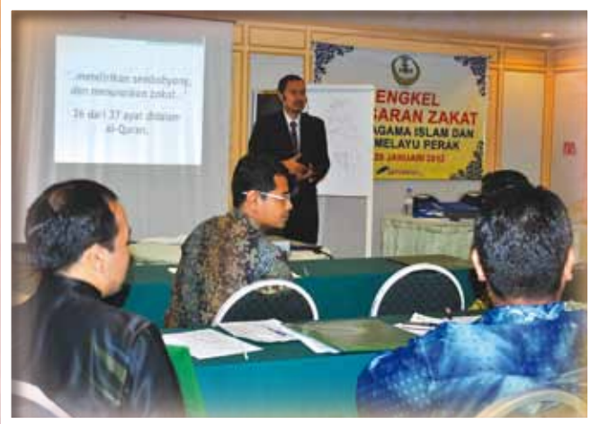
PARA PESERTA MENDENGAR TEKNIK PEMASARAN ZAKAT SEMASA BENGKEL PEMASARAN ZAKAT YANG DIADAKAN PADA 18 SEHINGGA 20 JANUARI 2012