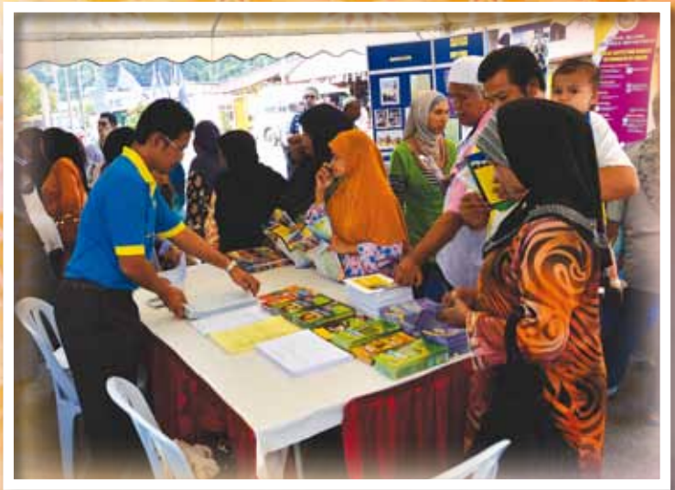
MASYARAKAT SEKITAR PULAU PANGKOR MENDAPATKAN MAKLUMAT MENGENAI ZAKAT DI KAUNTER PELANGGAN MAIPK PADA 21 MAC 2012