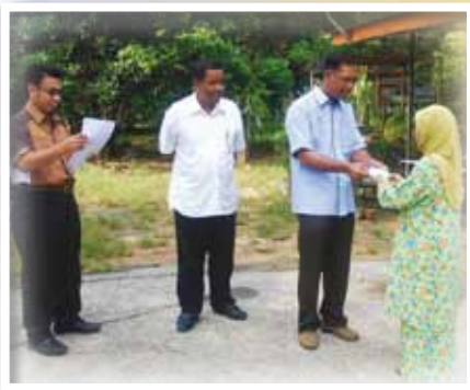
Orang Besar Jajahan Hulu Perak menyampaikan bantuan kepada salah seorang mangsa banjir