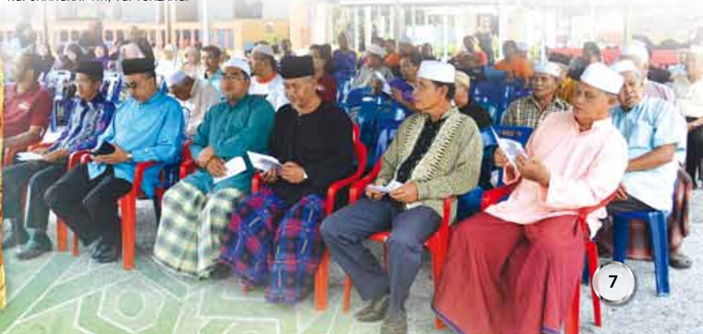
GAMBAR BAWAH KANAN : PARA TETAMU, PENDUDUK KG. CHANGKAT TIN DAN PENERIMA BANTUAN MENGAMBIL TEMPAT SEBELUM PROGRAM PERASMIAN PENUTUP DI PERKARANGAN MASJID AL-FALAHIAH, KG. CHANGKAT TIN, TG. TUALANG.