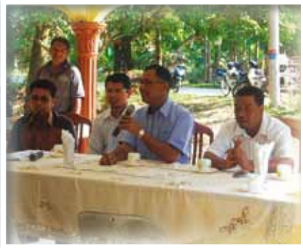
Orang Besar Jajahan Hulu Perak memberikan ucapan kepada penerima-penerima bantuan