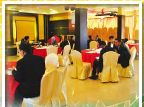
BENGKEL PEMURNIAN PERJAWATAN MAIPK DIADAKAN PADA 22 SEHINGGA 23 FEBRUARI 2012