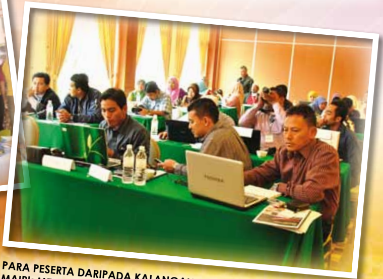
PARA PESERTA DARIPADA KALANGAN PEGAWAI-PEGAWAI MAIPK MENGIKUTI BENGKEL FOTOGRAFI YANG DIADAKAN PADA 26 SEHINGGA 28 MAC 2012