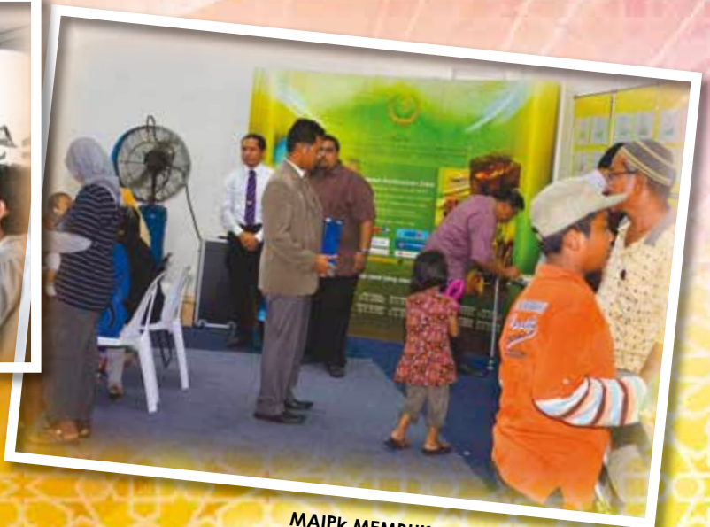
MAIPK MEMBUKA KAUNTER PELANGGAN DI RURAL TRANSFORMATION CENTRE, GOPENG PADA 18 FEBRUARI 2012