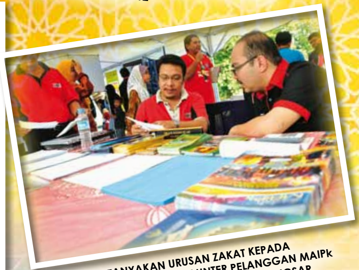
PELAWAT BERTANYAKAN URUSAN ZAKAT KEPADA PEGAWAI MAIPK SEMENA KAUNTER PELANGGAN MAIPK YANG DIBUKA DI KG. SENGGANG, KUALA KANGSAR PADA 28 APRIL 2012